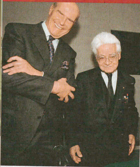
L'APPROVAZIONE Sopra, Di Bella con l'oncologo Umberto Veronesi (1925-2016). Nel 2012 l'Istituto europeo di oncologia, diretto proprio da Veronesi, certificò la validità della terapia Di Bella.